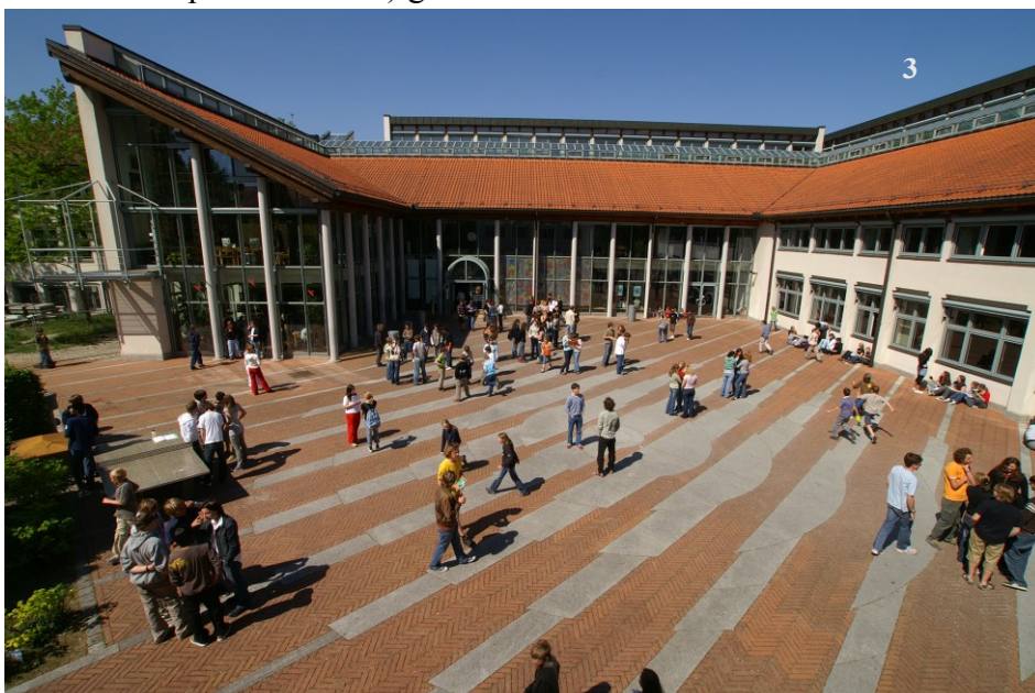
Ignaz-Taschner- Gymnasium Dachau